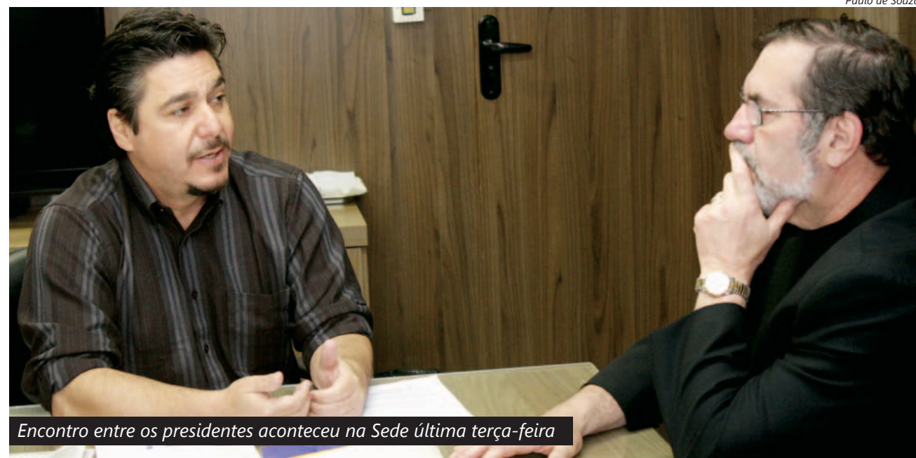
Encontro entre os presidentes aconteceu na Sede última terça-feira