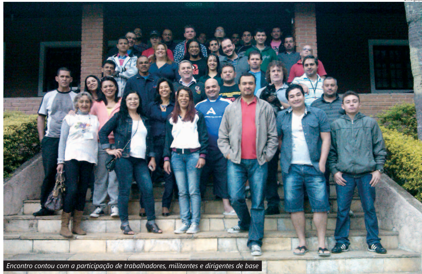
Encontro contou com a participação de trabalhadores, militantes e dirigentes de base

Potencial A conclusão foi que, só assim, analisando as necessidades de qualificação profissional, segurança, autonomia e condições dos companheiros com deficiência, eles poderão ser entendidos e desenvolverem plenamente seus potenciais profissionais. (Confira ao lado os objetivos de